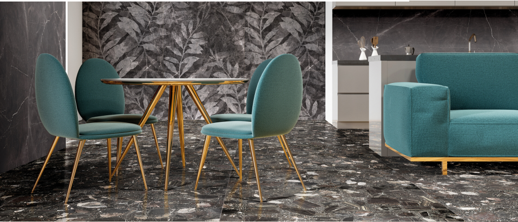
Épaisseur | Thickness : 10mm

MARCHAND DE CARRELAGE + PIERRE | TILE + STONE MERCHANT